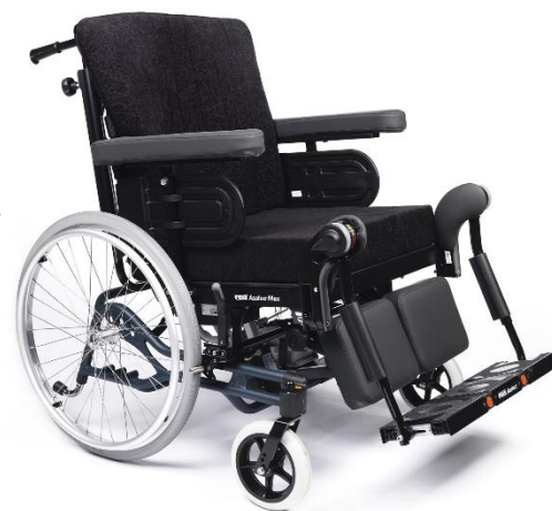
Rea Azalea Max

Skötsel: Produktens förväntade livslängd är 5 år när den sköts enligt leverantörens riktlinjer.