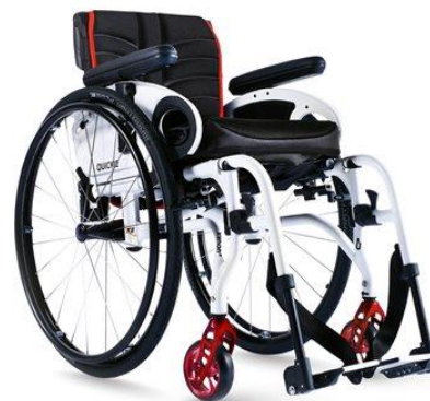
Quickie Xenon 2 SA

Beskrivning: Rullstol med kryssfällbar ram och avtagbara benstöd. Sittbredd 32-50 cm. Max brukarvikt: 125 k