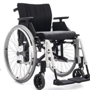
Crissy Swing Away

Beskrivning: Rullstol med kryssfällbar ram och avtagbara benstöd. Max brukarvikt 125 kg. Sittbredd 37,5-50 cm. (Sitthöjd fram 40,5-50 cm.)