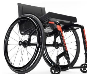
Kuschall KSL 2.0

Beskrivning: Rullstol fast ram med fotbåge. Max brukarvikt 100kg. Sittbredd 34-44 cm.