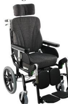
HD Balance 16