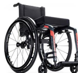
Kuschall Champion 2.0

Beskrivning: Rullstol med hopfällbar ram och hel uppfällbar fotplatta. Max brukarvikt 120 kg. Sittbredd 36-48 cm.