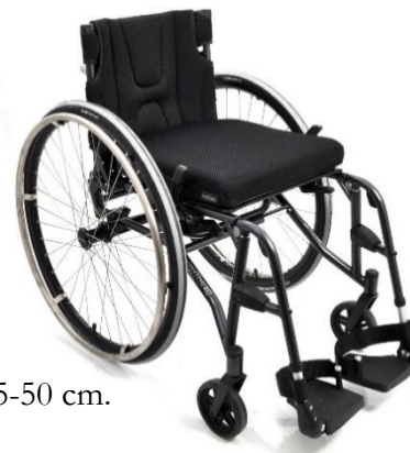
Panthera S3 Swing

Max brukarvikt 100 kg sittbredd 36-42 cm och 150 kg sittbredd 45-50 cm.