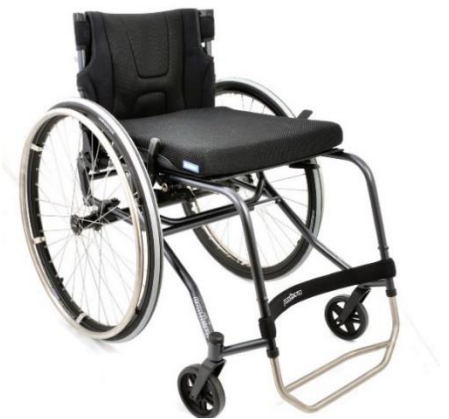
Panthera S3 large