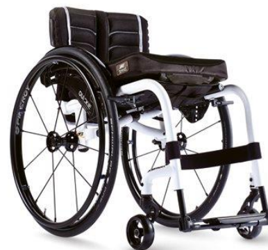
Quickie Xenon 2 FF

Beskrivning: Rullstol med kryssfällbar ram och uppfällbar fotplatta. Sittbredd 32-46 cm. Max brukarvikt: 110 kg.