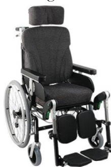
HD Balance 24