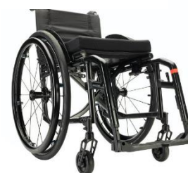
Kuschall Compact SA 2.0

Beskrivning: Rullstol med kryssfällbar ram och avtagbara benstöd. Max brukarvikt: 130kg. Sittbredd 28-50 cm.