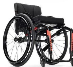
Kuschall K-serie 2.0

Beskrivning: Rullstol fast ram med fotbåge. Max brukarvikt 130kg. Sittbredd 32-50 cm.