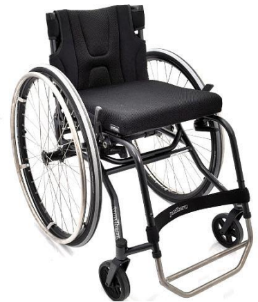
Panthera S3 kort

Max brukarvikt 100 kg sittbredd 30-42 cm, 150 kg sittbredd 45 cm.