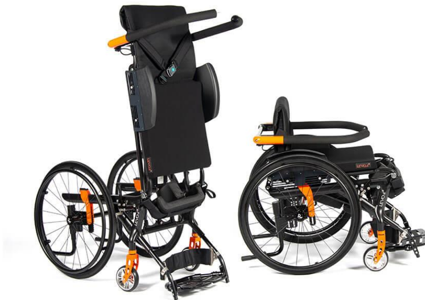
Levo Summit El